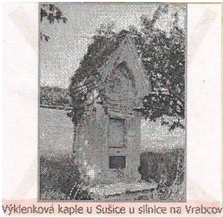
Výklenková kaple u Sušice u silnice na Vrabcov

A nyní již ke kapličce Panny Marie Bolestné, která se nachází u silnice směrem na Vrabcov. Jde o zděnou, pseudogotickou, výklenkovou kapličku obdélníkového půdorysu. Čelní strana této kapličky je tvořena dvakrát odstupněnou, na výšku obdélnou nikou, v níž je shora další, malá obdélníková nika a pod ní na šířku obdélná deska z leštěné žuly s vyrytým nápisem. Tento nápis má