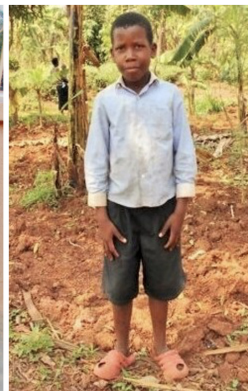
Innocent 10 let