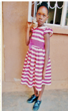
Christine 11 let