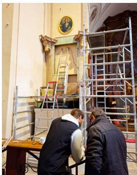
Probíhající sestavování restaurovaného bočního oltáře

Naplánován je Večer pro všechny a také zveme na silvestrovské chvály. To jsou vzdálené pozvánky... Ale velmi brzy už zakusíte v našem kostele další nepřehlédnutelnou změnu. Podle fotografie snadno poznáte, čeho se týká. Už teď máme radost, jak nám budou oba oltáře v presbytáři ladit.