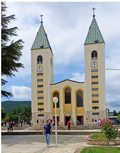
Farní kostel sv. Jakuba.

Každý den jsme začínali v 8 hodin slavením české mše svaté a pak pokračovali dalším programem, při modlitbě růžence jsme vystoupali na Podbrdo – kopec zjevení Panny Marie, další den jsme se modlili křížovou cestu a šplhali kamenitým terénem na Križevac. Také jsme navštívili Cenacolo – komunitu, kde se mladí muži pokoušejí zbavit různých závislostí a najít nový smysl života pomocí modlitby, práce a služby bližním, vyslechli jsme si i dvě