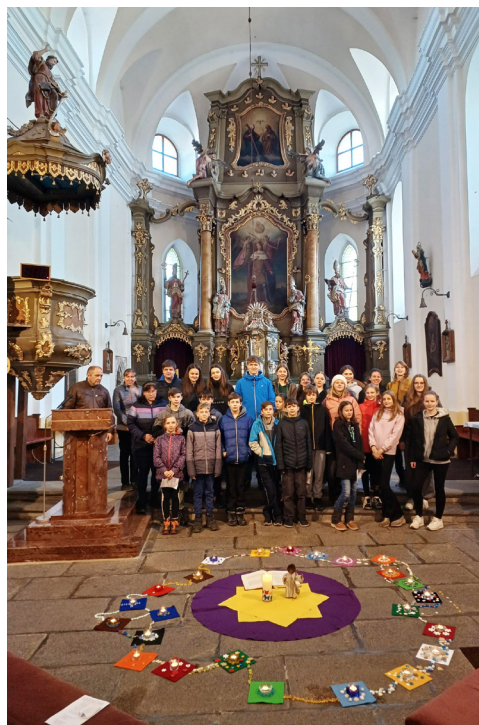
Duchovní setkání dětí a mládeže v Sušici.