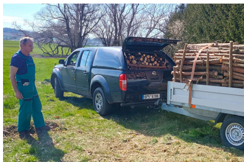
Bratři s pomocníky „makali“ v lese.

Ve čtvrtek 29. 5. se na kapucínské zahradě sešly děti se svými rodiči. Tento-