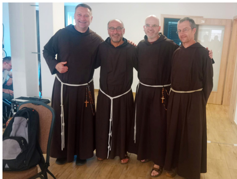
Čeští bratři s Maranesim.

otevřená pro františkánskou rodinu, takže jsme potkávali nejen slovenské spolubratry, ale také různé sestry a terciáře. Setkání bylo wow-skvělé, přednáška taky. Můžete si ji poslechnout na youtubovém kanálu Kapucíni čenl.