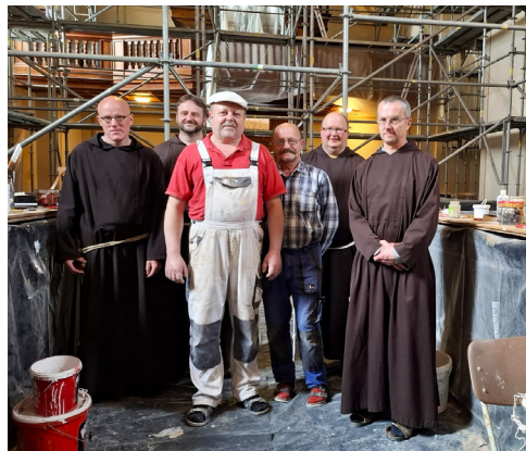
Bratři kapucíni spolu s malíři.

Jak to tedy s opravami a s restaurováním maleb pokračuje? Do poloviny června snad budou malby očištěny, zpevněny a barvy v nich zvýrazněny. Jen se vyskytla jistá „drobnost“: bylo nutné dát hlavy dohromady, jak vyřešit praskliny v kostele. Ty vznikly zhruba před dvaceti lety, kdy město provádělo v blízkosti kostela výkopové práce kvůli kanalizaci. Po poradě se statikem bylo rozhodnuto, že čelní zeď bude zevnitř zpevněna železnými pruty, které se do ní zafrézují. Příští rok se bude staticky zpevňovat přední zeď kostela i z vnější strany. A vypadá to, že by se potom mohly opravit i vnější praskliny, aby do omítky nezatékalo. A pravděpodobně se bude také natírat fasáda. Více se dozvíme na kontrolním dni, ten je naplánovaný na 12. 6. Pak by se demontovalo lešení a poprosili bychom