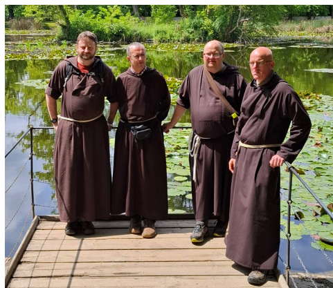
Bratři na výletě v Českém Krumlově.

Na co se v blízké době můžeme těšit? Když píšeme tyto řádky, tak ještě nevíme, jak moc se vydaří svatodušní vigílie v Kašperských Horách nebo sušické farní