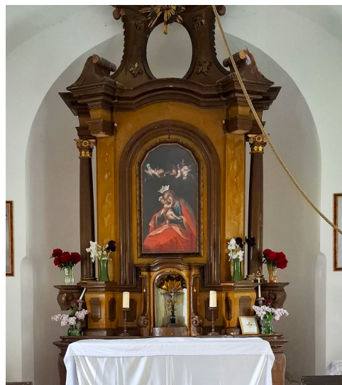
Kaple Panny Marie Pomocné.