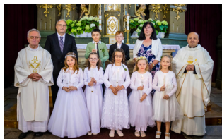
První svaté přijímání.