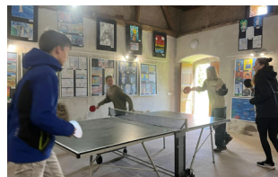
Společná hra na duchovním setkání v Nepomuku.