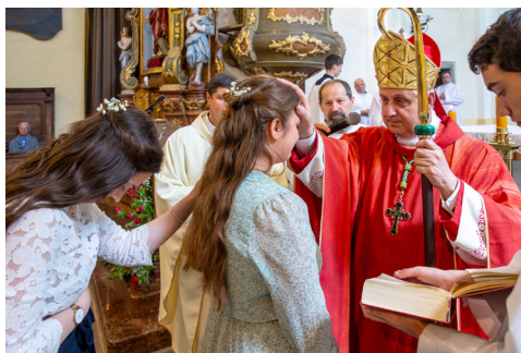
Fotografie z břimování (12. 6. 2022).

Kánon 842 – § 2. Svátosti křtu, břimování a Nejsvětější eucharistie tak mezi sebou jsou spojeny, že se žádají k plnému uvedení do křesťanského života (iniciaci).