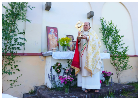
Slavnost Těla a krve Páně na Andělíčku.