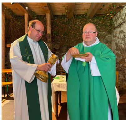
FamilyCamp – závěrečná mše sv.

V okamžiku, kdy dopisujeme tyto řádky, tak pomaličku končí „utajená“ akce v Petrovicích, která byla určena pro „hledající“. Moc velké díky všem, kdo ji připravili.